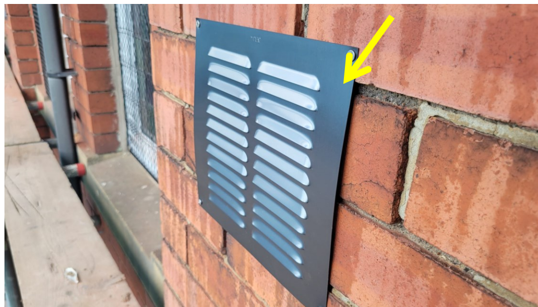
外墙翻新（第二阶段）