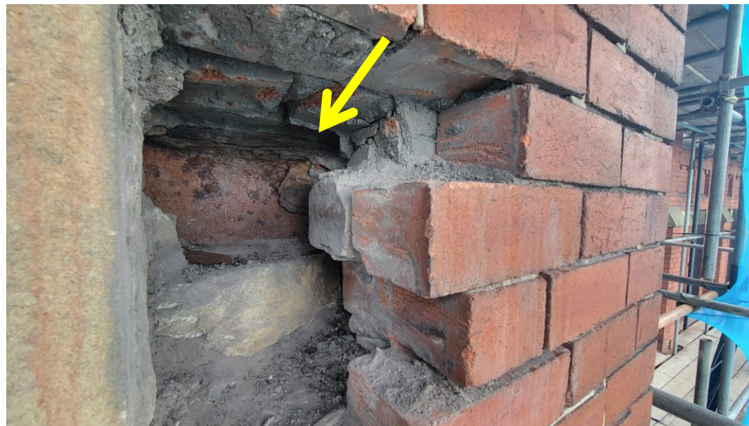
外墙翻新（第二阶段）