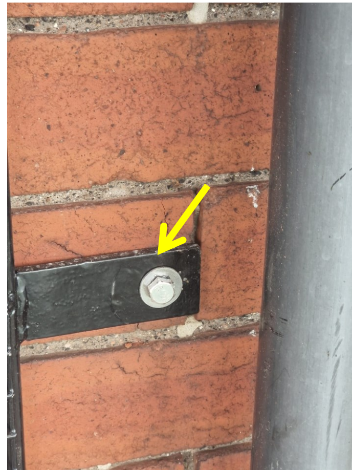
外墙翻新（第二阶段）