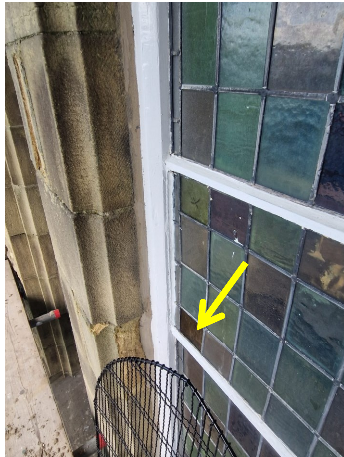
外墙翻新（第二阶段）