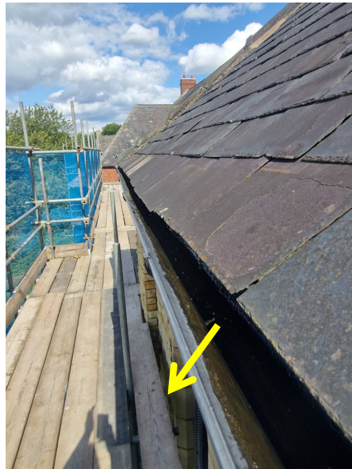
外墙翻新（第二阶段）