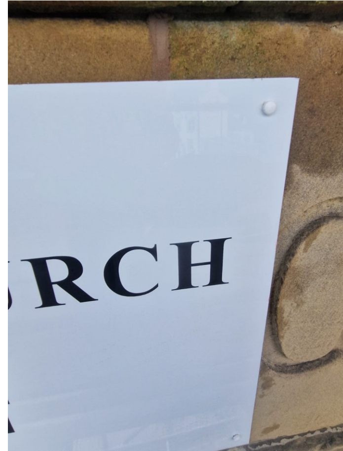
外墙翻新（第二阶段）