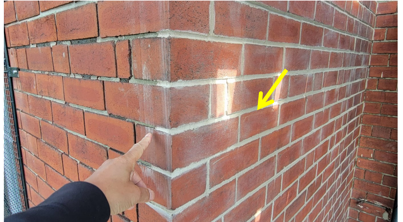
外墙翻新（第二阶段）