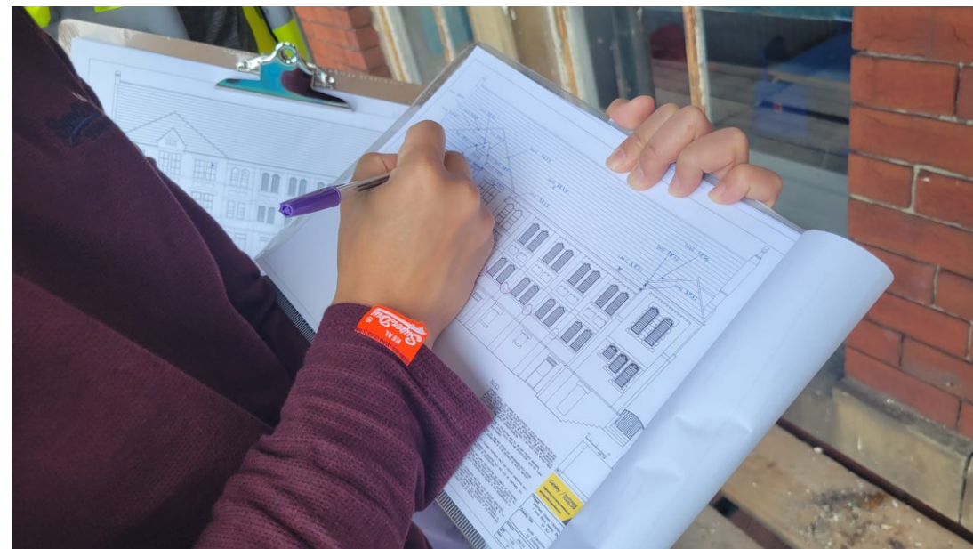
外墙翻新（第二阶段）